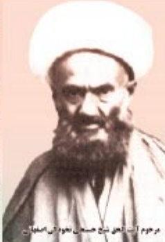
مرحوم آیت الله شیخ حسین بن علی نغزودکی اصفهانی

مرحوم حاج شیخ حسینی نغزودکی اصفهانی رحمته که در کنار مطبخ شریف آقا علی ابن موسی الرضا علیه السلام آرمیده و صاحب کرامات فراوانی بود و در میان چهره های شناخته شده از اولیاء الله، دارای قدرت مهم روحی و از نیروی بسیار کم نظیر بهره مند بوده است. او از دوران کودکی به عبادت و ریاضت های شرمی اشتغال داشت و زحمات فراوان و طاقت فرسایی را برای رسیدن به اهداف بلند روحی و معنوی خود متحمل شده بود. او هر چه از لَذکار و اوراد و ختمات و هم چنین نماز